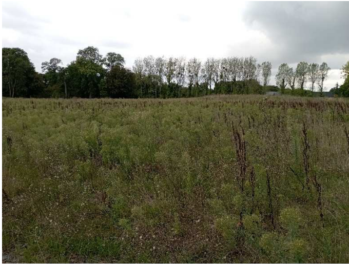
Vue vers le nord